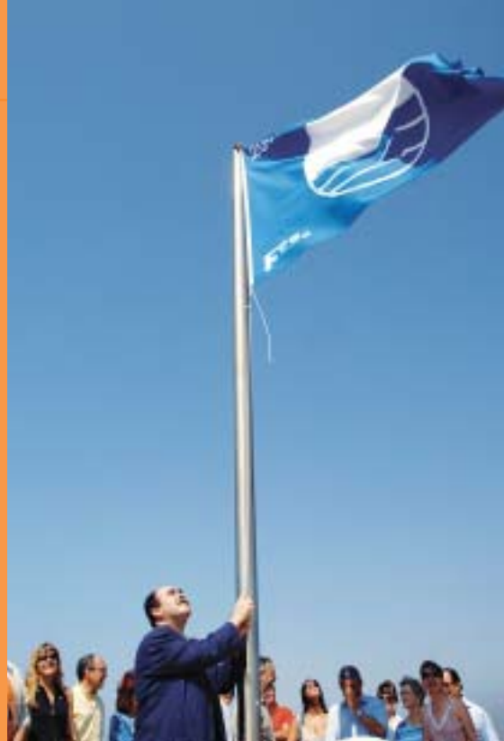
La bandera es va hissar l'1 de juliol, en un acte presidit per l'alcalde